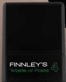
75ml. Holdfactor: 4 Adviesprijs: € 13,95