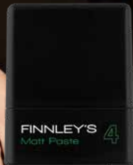
75ml. Holdfactor: 4 Adviesprijs: € 13,95