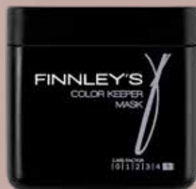
200ml. Carefactor: 5 Adviesprijs: € 14,95