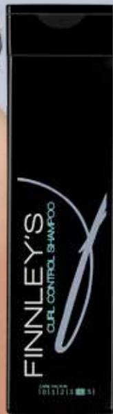
250ml. Carefactor: 4 Adviesprijs: € 13,95

De Curl Control Mask is voor de extra verzorging van natuurlijk krullend en gepermanent haar. Milde ingrediënten in combinatie met het unieke natuurlijke Proteïne zorgen voor elasticiteit, glans en veerkracht. Finnley's Curl Control Mask is verkrijgbaar in 200ml en voor professioneel gebruik in 500ml.