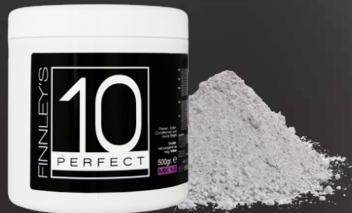
500gr MIX 1:2

Inwerktijd: 10-50 minuten, afhankelijk van de gewenste resultaat.