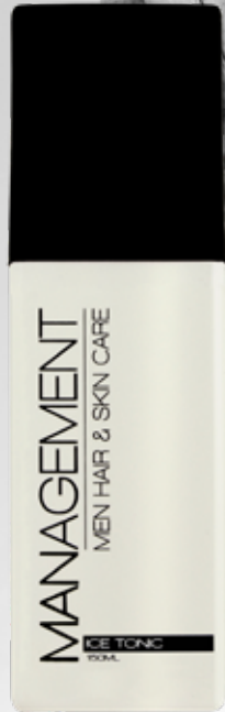
150ml. Carefactor: 2