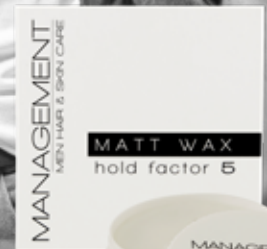
100ml. Holdfactor: 5