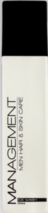
200ml. Carefactor: 3