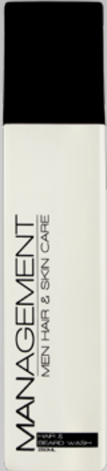
200ml. Carefactor: 3