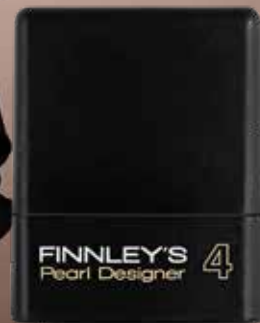
75ml. Holdfactor: 4 Adviesprijs: € 13,95