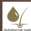
Hydrating hair mask