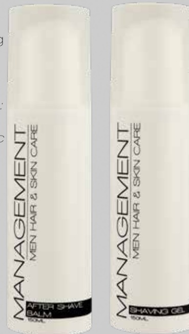
150ml. Carefactor: 3

De Matt Wax is een matte styling waxpasta met een holdfactor 5 en een matte afwerking.