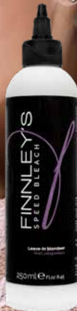
250ml. Tot 3 tinten