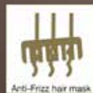
Anti-Frizz hair mask