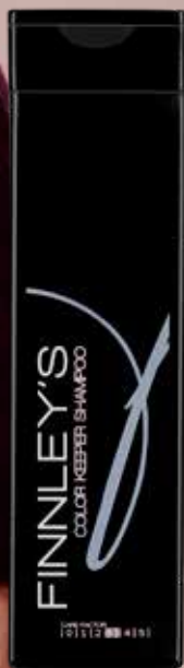
250ml. Carefactor: 4 Adviesprijs: € 13,95