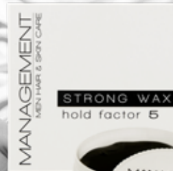
100ml. Holdfactor: 5