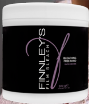
500ml. Tot 6 tinten

Finley's Embossed Foil is een folie met een reliëf van 12,7cm breed en wordt geleverd op een rol van 100meter. De dikte van de folie is 15mic. Door het reliëf krijgt het product meer zuurstof en ontwikkelt zich beter, daarnaast heeft het meer grip op het haar dan traditionele folie.