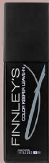
150ml. Carefactor: 4 Adviesprijs: € 13,95