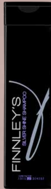
250ml. Carefactor: 2 Adviesprijs: € 13,95