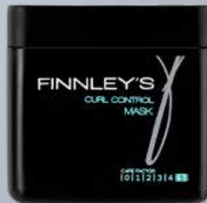
200ml. Carefactor: 5 Adviesprijs: € 14,95