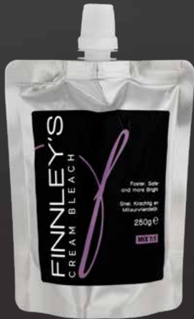
250gr. MIX 1:1

MIX 1:1, kan gebruikt worden met 10-20-30-40 volume Developers.