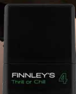
75ml. Holdfactor: 4 Adviesprijs: € 13,95